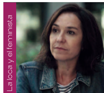
La loca y el feminista