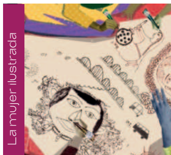
La mujer ilustrada

Diversxs es el primer guió audiovisual dedicado a la diversidad de la nueva generación de manos de la ONG Apoyo Positivo, dirigido por Afi Oco y Jorge Garrido. Un cortometraje que explora algunas de las diferentes diversidades de jóvenes que convivieron durante 5 días, visibilizándolas.