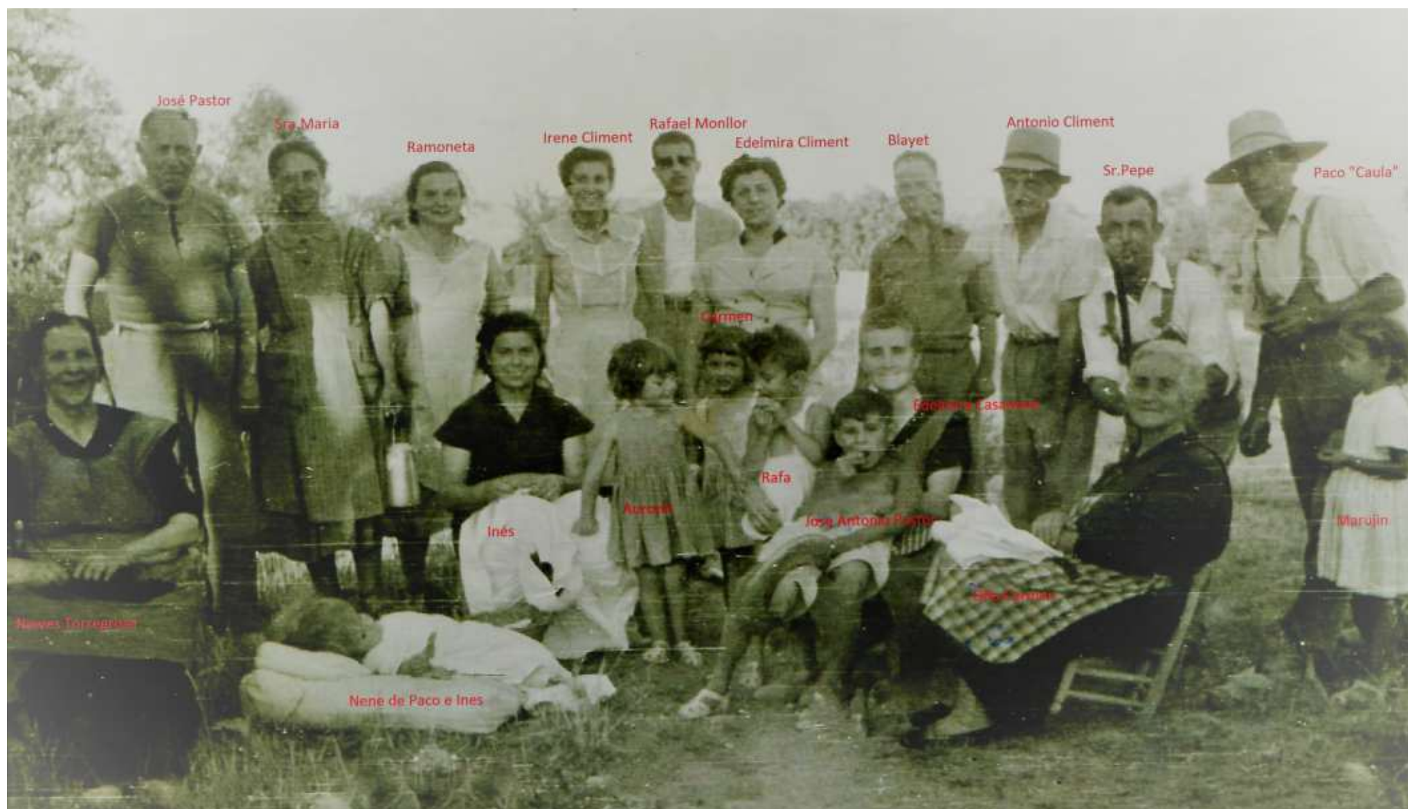
Grup de veïns en l'era del Frances. Anys 60