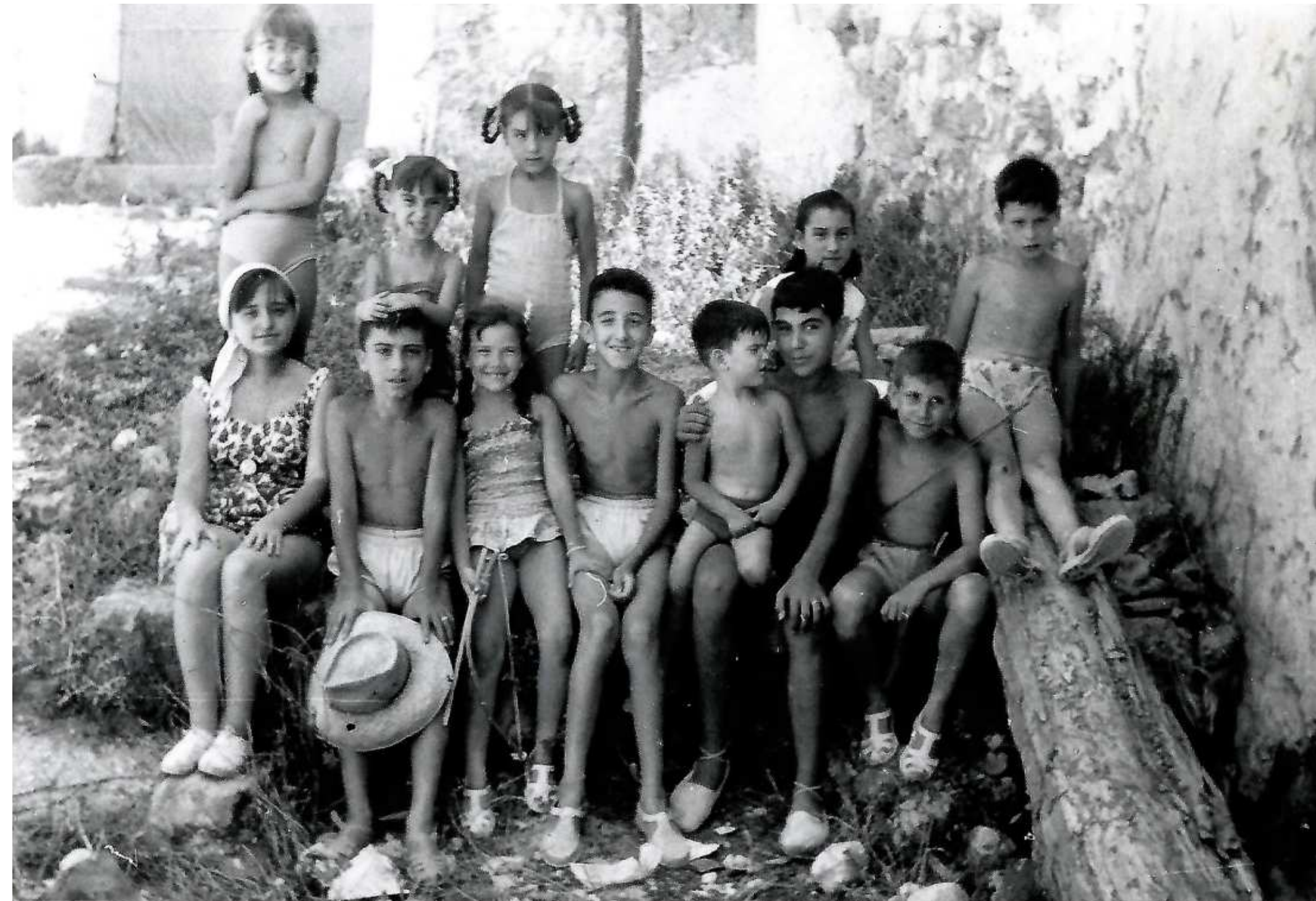
Què bé ho passàvem. Anys 60