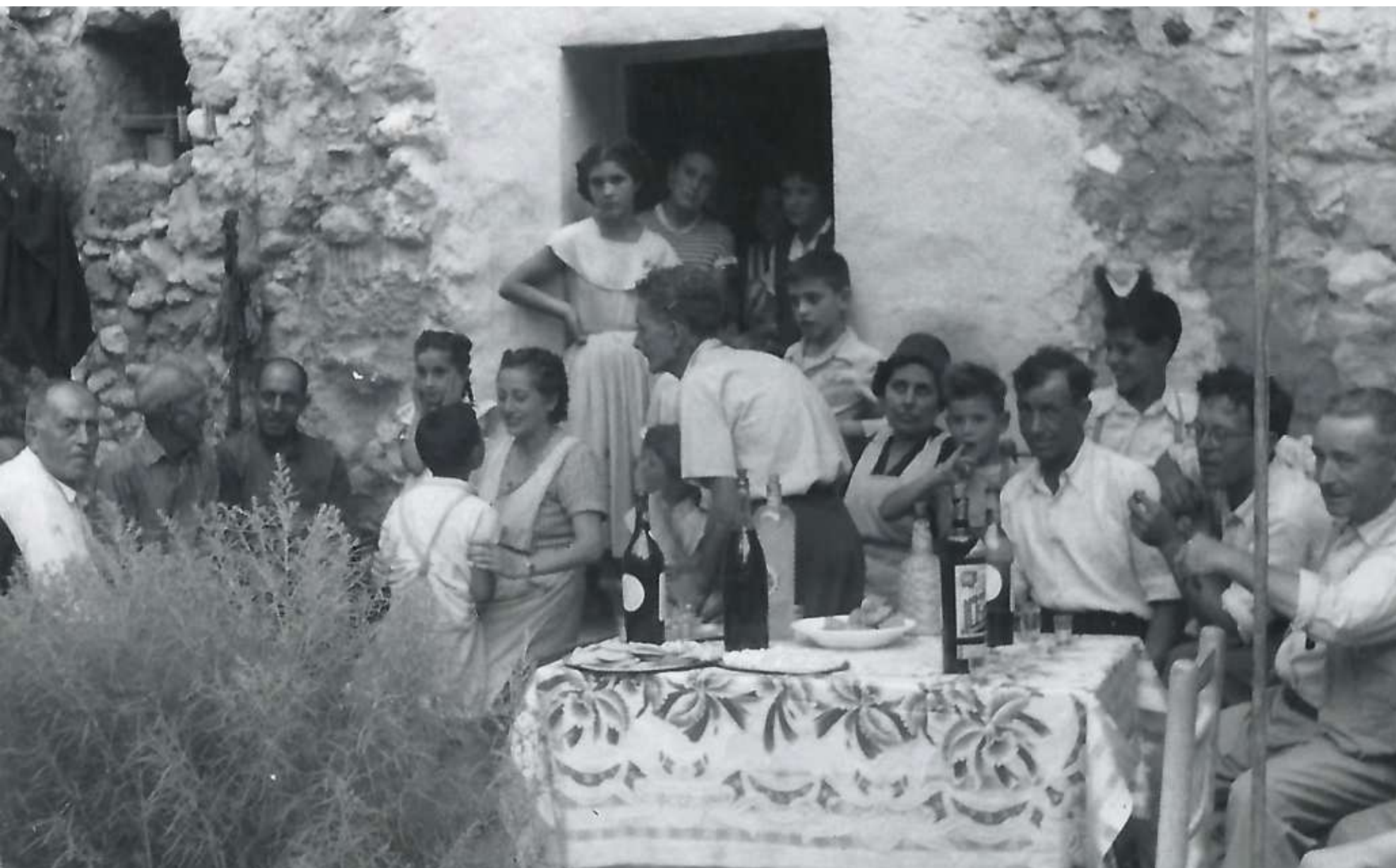
Reunió en festes Turballos

Festes Turballos 2023 - 16 i 17 de setembre de 2023