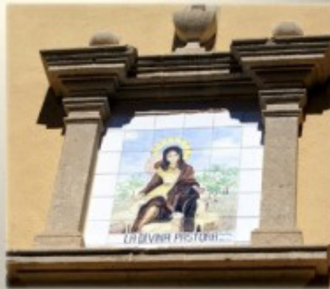
«La Divina Pastora»