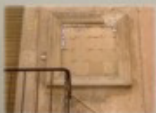
C/ Music Esteve