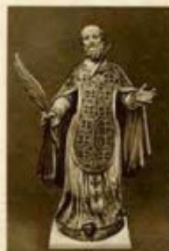
San Caralampio prebitero y mártir Imaginó que se venera en la Capilla del Seminario de la Faja (Santiago)