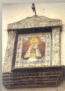
Avinguda Valencia, 4