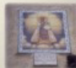
Plaça la Vila